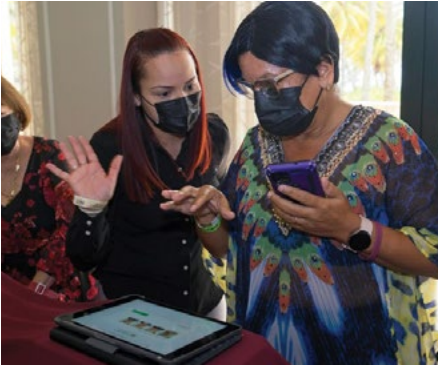
Socios en el proceso de votación.

CFCU es una cooperativa de crédito de avanzada, compuesta de más de 48,000 personas (nosotros, los socios) unidas de forma voluntaria para satisfacer nuestras necesidades económicas. En Caribe impera la doctrina que sustenta los valores y principios universales del cooperativismo y las prácticas de buen gobierno. Fundada modestamente por un grupo de visionarios empleados federales allá para el 1951, es una organización que ha usado de la manera más responsable el modelo cooperativista a través del concepto de ayuda mutua y esfuerzo propio.